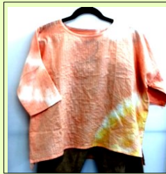
チュニックを2色で染める。

数年前に仲間で茜染めの工房を始め、その後ベンガラ染めと出会う。 場所も選ばず、短時間で水と染料のみで染めることができるベンガラ染めの手軽さと楽しさに魅せられ、現在伝える立場で活動中。