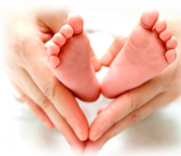
ベビーマッサージ 第2火曜日