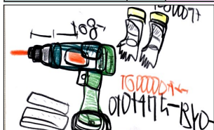
日曜アートA 第1・3日曜