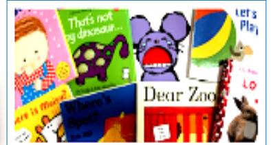
ベビー英語レッスン ・0才児・1歳児クラス